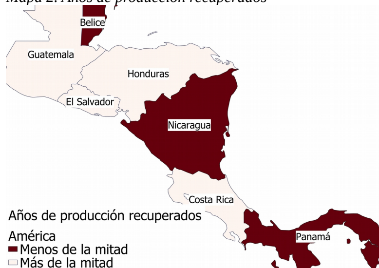
Mapa 2. Años de producción recuperados

El trabajo migrante y el anclaje con la economía estadounidense vía la maquila les permitieron poca pérdida de años de producción y una recuperación de más de la mitad de años perdidos en Costa Rica, El Salvador, Guatemala, Honduras y Nicaragua. Al contrario, Panamá y Belice cayeron muchos años y recuperan menos de la mitad con una demanda externa impactada por la crisis de Ecuador y por el Brexit. Finalmente, tanto la demanda